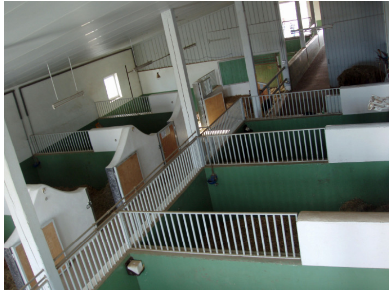
Draussen: Gesunde Luft, viel Licht, im Bild der Stutenstall

Wir sind mit dieser Anerkennung das am südlichsten gelegene Vollblutgestüt Deutschlands und mit nur 20 Autominuten vom Flughafen Zürich aus auch für Schweizer Züchter ideal erreichbar.