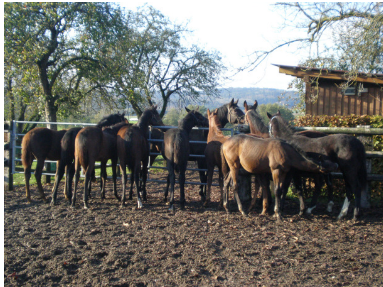
Draussen: Auch auf den Paddocks macht's Spass und ist immer interessant

Gestüt Berwangerhof Kreisstrasse 8a D-79802 Dettighofen- Berwangen Tel: +49 77 45 91122 Fax: +49 77 45 91123 www.berwangerhof.ch info@berwangerhof.ch