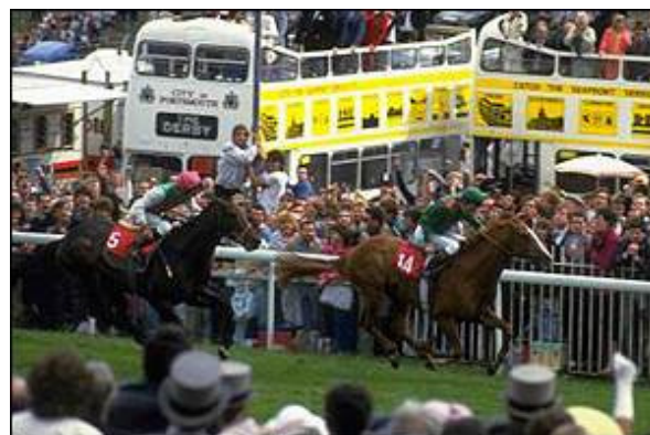
Dancing Brave (left): One of the best horses ever

1987 war Trempolino genau 2 Sekunden schneller als Mill Reef und San San in den Jahren 1971 respektive 1972, was bei den gelaufenen Geschwindigkeiten einem Vorsprung von 32,8 m entspricht. Daraus zu schliessen, dass Trempolino die beiden Pferde um 13 Längen geschlagen hätte, wäre allerdings nicht richtig. Jedes Rennen hat einen anderen Verlauf, die klimatischen Verhältnisse können variieren und damit für unterschiedliche Bodenverhältnisse sorgen. Wichtig auch ist das uneinheitliche Startprozedere: von 1920 bis 1963 aus dem Schritt, dann aus dem Stand und seit 1964 aus der heute bei allen Flachrennen üblichen Startmaschine. Sicher ist trotz allem, dass die Rennen schneller geworden sind.