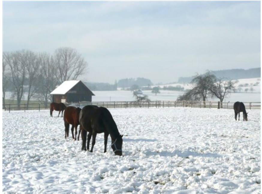
Wochenlang richtig schöne Winterweiden - ideales Pferdewetter

Als Komplikationen auftraten (Steisslage), wurde rasch entschieden, die Stute in's Tierspital Zürich zu transportieren, wo um vier Uhr morgens eine hochkarätige Ärztemannschaft, bestehend aus Gynäkologen, einem Chirurgen und Pflegepersonal, einsatzbereit war. Und, wie durch „mehrere Wunder“, wurden weder „Tisch noch Kran noch Messer“ benötigt und um fünf Uhr morgens waren Stute und Fohlen zufrieden in „ihrem Krankenzimmer“. Unser Sicherheits-Dispositiv hat sich bewährt – und einmal mehr haben wir höchste Kompetenz und Zuverlässigkeit im Tierspital Zürich bestätigt erhalten.