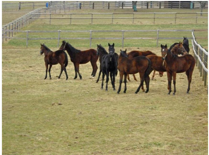
Warten auf grünes Gras—wie immer in dieser Jahreszeit

Die Stute ist für dieses Jahr gebucht bei Dashing Blade (Elegant Air).