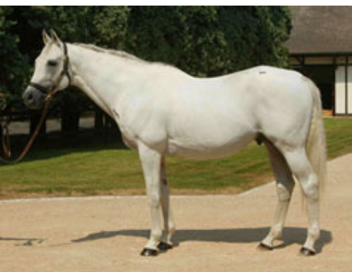
Linamix-Blut durch Kauf Lagardère

4. Früher hätte er sich nie getraut, auch „fremde Blutlinien“ wie das amerikanische Blut, einzukreuzen und die gleichen Stuten über drei oder vier Jahre dem gleichen Hengst zuzuführen. Das sei ein Fehler gewesen, mit dem Kauf des Gestüts von Jean Luc Lagardère mache er nun viel Zeit gut. Allerdings vergehe wieder Zeit, bis er die neuen Familienverbindungen genauer kenne. Das detaillierte Studium der Blutlinien über Generationen hinweg hat bei Aga Khan offensichtlich System.