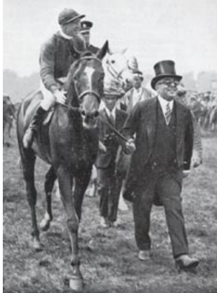
Grossvater mit Derby-sieger Blenheim

Was für einen grossen und global agierenden Züchter wie Aga Khan gilt, hat auch grossen Aussagewert für kleine Züchter: