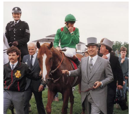
Aga Khan mit Derby-Sieger Shahrastani

3. Auch bei Aga Khan fängt die Hengstauswahl mit der Suche nach bewährten Verbindungen (Nicks) an und als Beispiel nennt er Nasrullah und Princequillo . Nasrullah wurde von seinem Grossvater selber gezogen, Prince Bio (Prindequillo) hat er dazugekauft und der entsprechende Nick sei bis heute in seiner Stutenherde stark verankert. So auch bei Zarkava ! Viele der heutigen Züchter, so Aga Khan, gäben diesen Verbindungen zu wenig Bedeutung, weil Pédigrée Analysen praktisch über nie mehr als fünf Generationen gemacht würden. Ein grober Fehler, wie er versichert. Aber auch eine Chance für kleine Züchter, ab und zu „eingeschlafenes, gutes Mutterblut“ einkaufen zu können.