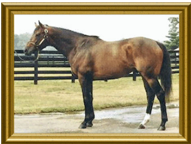
Chief's Crown (vererbt Sprinter plus Steher)