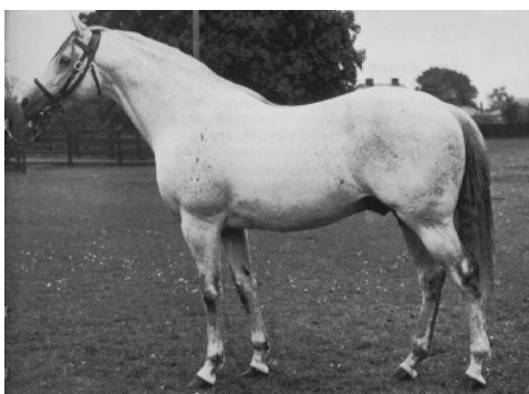
Grey Sovereign (Sprinter)

Weitaus am meisten Hengste finden wir in der gegenüberstehenden Liste in der klassischen Distanzgruppe „C“, weil in den letzten Jahrzehnten das Zuchtziel Derby mit 2,400 m überall auf der Welt im Mittelpunkt stand.