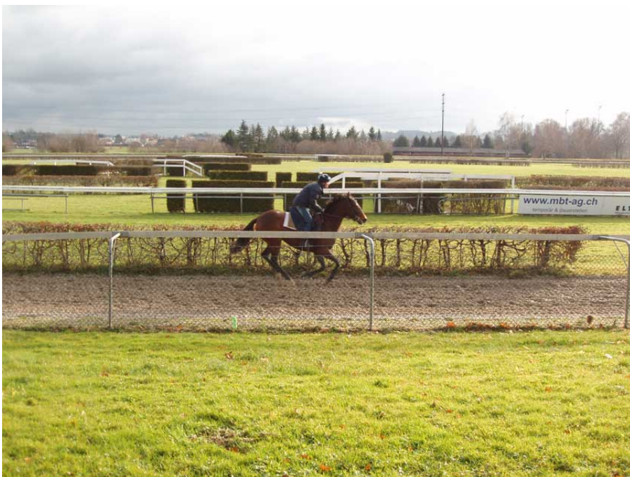
Lawtaya bei ihrem Arbeitsgalopp