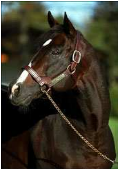
Danzig 1999

Danzig produzierte neun Stakes-Pferde, davon drei G1 -Sieger, aus Mr. Prospector -Stutenlinien. Auch andere Zweige der Raise a Native -Vaterlinie wie Exclusive Native , Affirmed , Alydar , Alysheba , Turkoman und Easy Goer brachten in Verbindung mit Danzig zahlreiche Blacktype-Pferde. Die Danzig-Linie müsste auch zu den Söhnen von Mr. Prospector und damit generell zur Native Dancer -Familie (z.B. Zweig Sharpen Up ) passen.